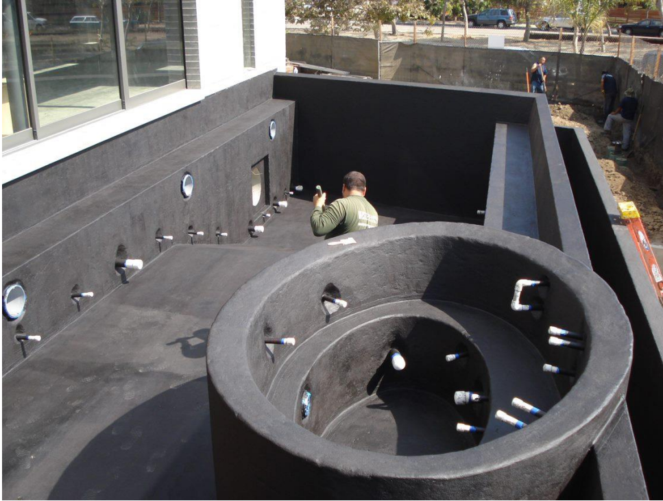
הנחת ווינגריפ ביטומני בבריכה

לעומת זאת עבור וואן ו-וואן פלורינג ניתן אישור עמידות לאש בהתאם ל-UNI EN 13501-1, סיווג עמידות לאש של מוצרי הבנייה. וואן הינו חומר איטום נוזלי צבעוני אשר ניתן ליישום גם בטמפרטורות קיצוניות (בין 0 ו-45 מעלות צלסיוס) ועל משטחים לחים או רטובים, בעוד ש-וואן פלורינג הינו חומר הגנה אטום למים, נוזלי, פיגמנטי, בעל רכיב יחיד, עמיד לקרניים אולטרה-סגוליות, בעל נוסחה ייחודית, המיועד להבטיח עמידות למים, אפשרות נסיעה עליו והגנה לאורך זמן על תשתיות עליהם הוא מיושם.